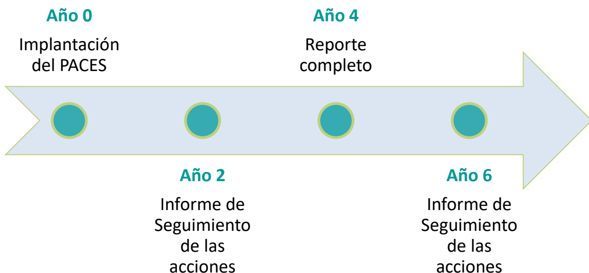
Gráfico 4. Proceso de Implantación y Monitorización del Plan de Acción.

La presentación de este Inventario de Emisiones de Monitorización es obligatoria cada cuatro años, de este modo que el municipio deberá llevar a cabo alternativamente, cada 2 años, un documento de “Informe de Seguimiento” (sin inventario de monitorización) y un “Reporte completo” que contenga el informe de seguimiento junto al inventario de emisión de monitorización.