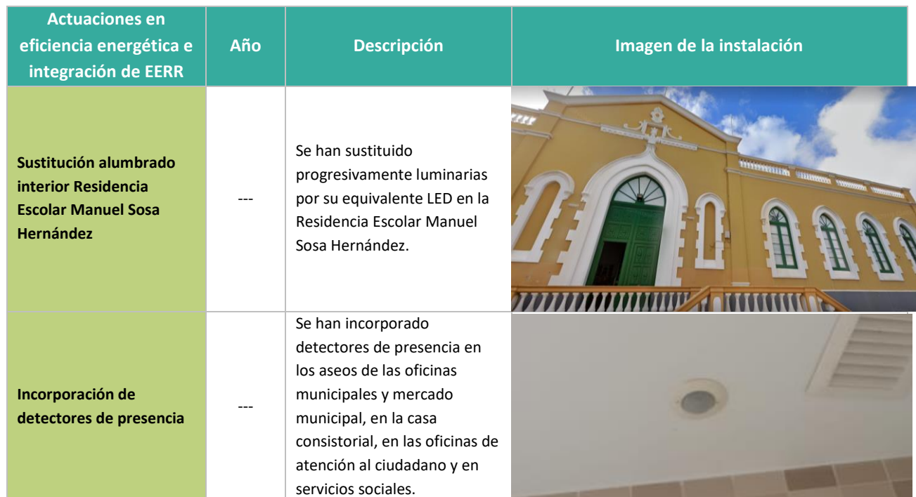
Tabla 9. Actuaciones desarrolladas en eficiencia energética e integración de EERR