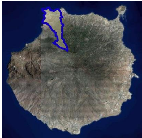
Figura 1. Ubicación del Municipio de Gáldar.

El Municipio de Gáldar está situado al noroeste de Gran Canaria, su extremo meridional se acerca a las cumbres de la isla, donde tienen uno de sus vértices varios municipios, mientras que por el otro lado desemboca al mar. Linda con los municipios de Agaete, Artenara y Santa María de Guía.