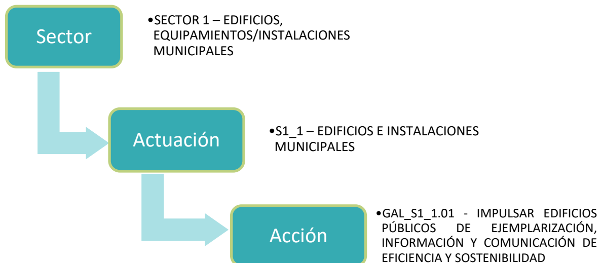
Gráfico 2. Diagrama de la dependencia de las acciones dentro del plan de acción.

Las acciones definen las medidas de mejora propuestas que van desde la aplicación directa sobre los elementos consumidores de energía, hasta el planteamiento de medidas dirigidas a ámbitos más generales como pueden ser colectivos concretos, que hacen uso de la energía o tienen incidencia en su actividad sobre ella.