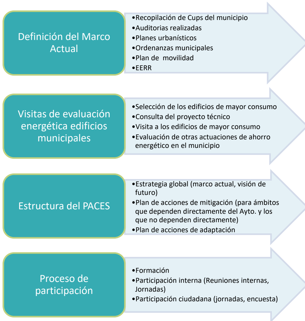
Gráfico 3. Diagrama de flujo de la metodología seguida para la realización de los planes de acción.

La metodología seguida para la realización de los planes de acción ha sido la presentada en el Gráfico 3, mostrada a continuación.